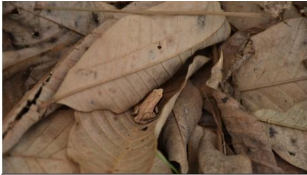
อิงข้างดำ