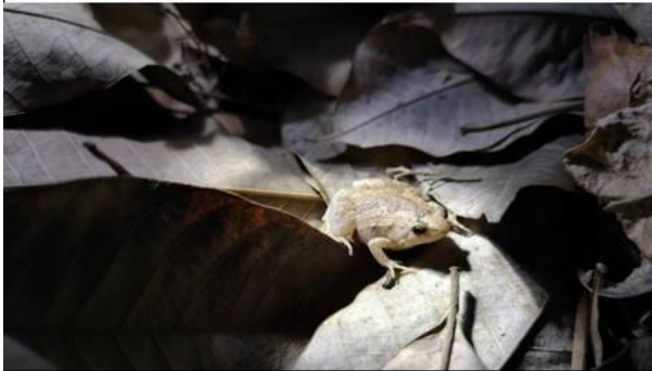
อิงน้ำเต้า