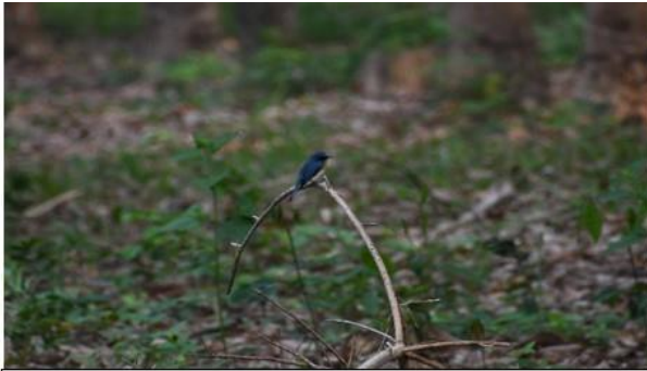
นกจับแมลงคอน้ำตาลแดง