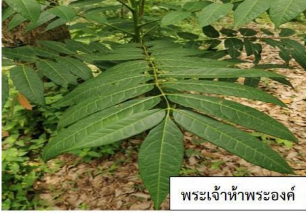
พระเจ้าห้าพระองค์