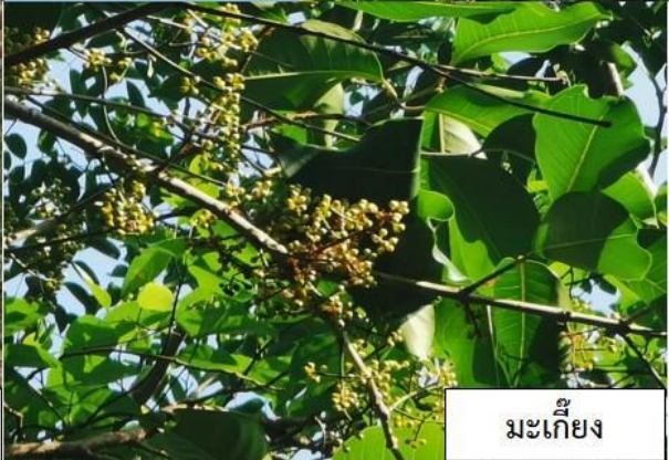
มะเกี๋ยง