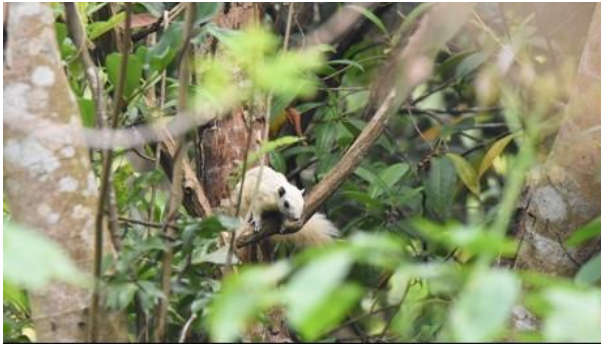
กระรอกหลากสี