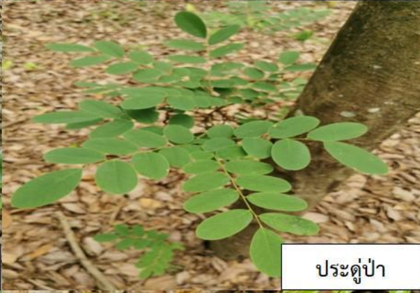
ประดู่ป่า