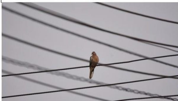
นกเขาใหญ่