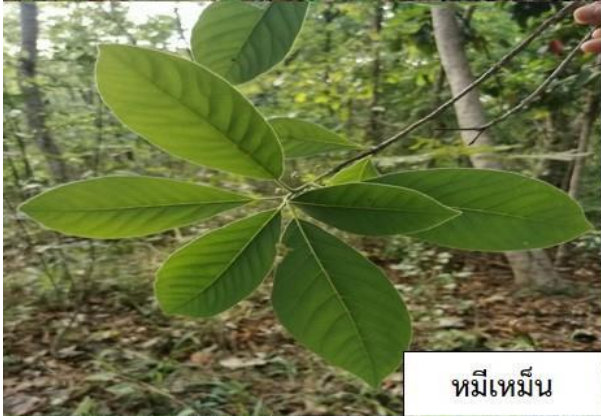
ทมิเหมิน