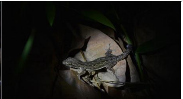
จิ้งจกหางหนาม