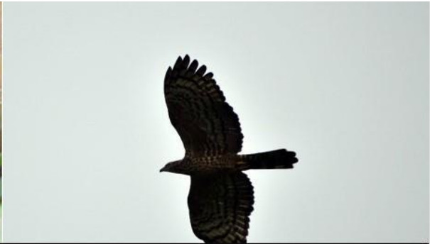
เหยี่ยวผึ้ง