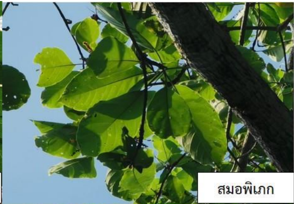
สมอพิเภก