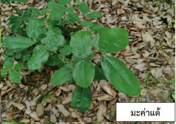
มะค่าแต้