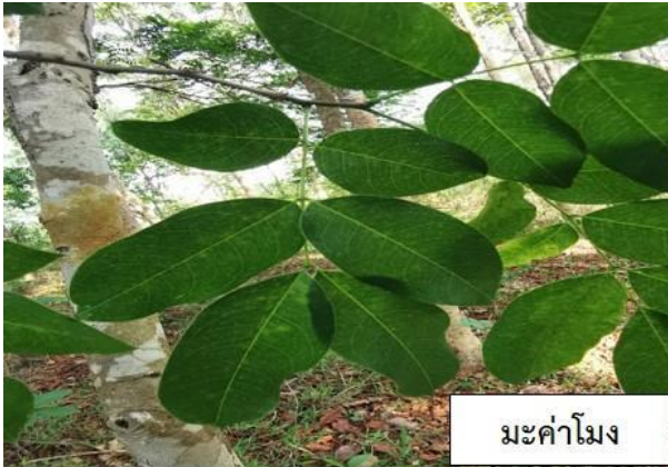
มะค่าโมง