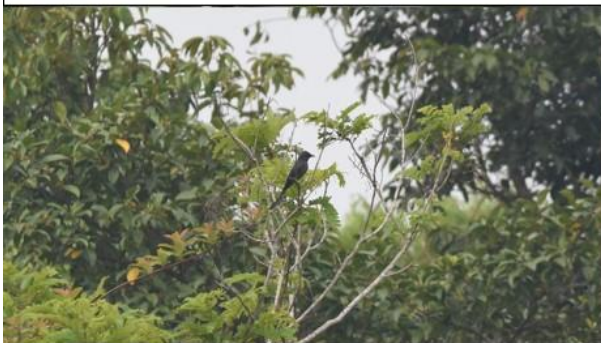
นกแขวงแซวหางปลา