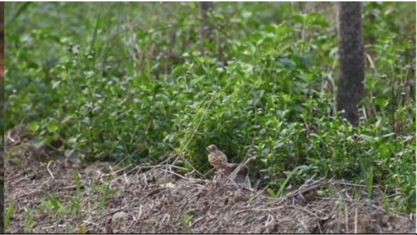
นกเค้าดินทุ่งใหญ่