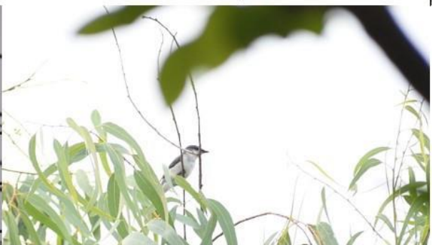
นกพญาไฟสีเทา