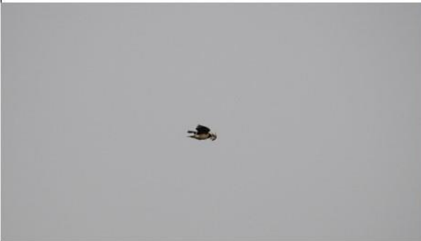
นกเอี้ยงดำ