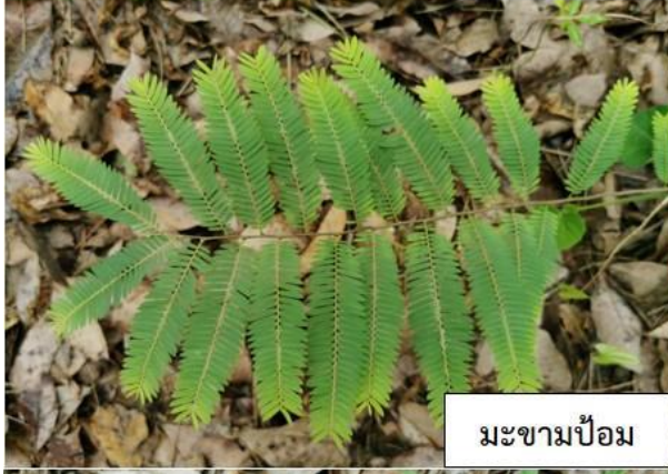
มะขามป้อม