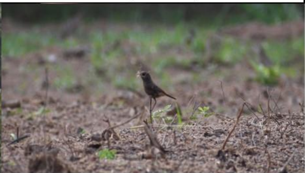
นกยอดหญ้าสีดำ