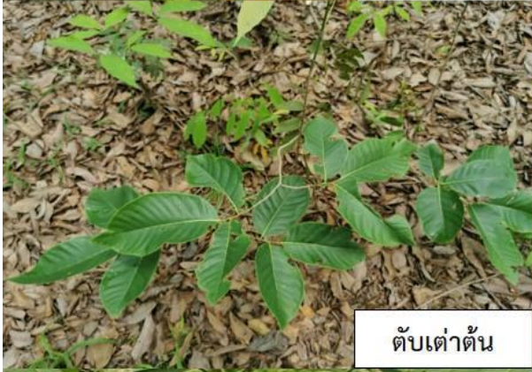
ตบเต้าตัน