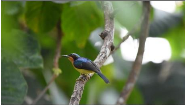
นกกินปลีแก้มสีทับทิม