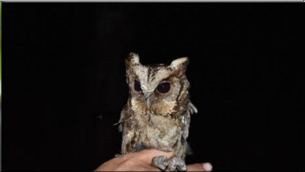
นกฮูก, นกเค้ากู่