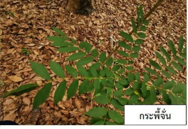
กระพี้จั่น