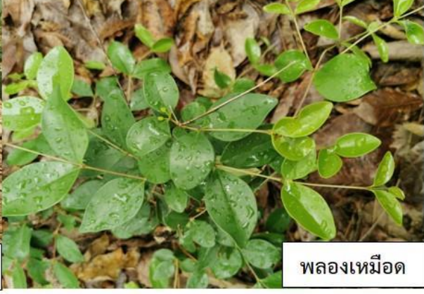
พลองเหมือด