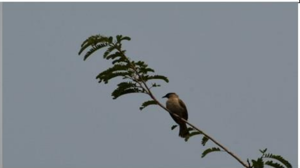
นกปรอดหัวสีเขม่า