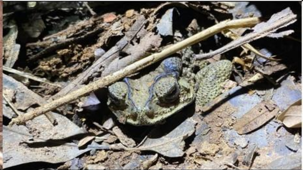
คางคกบ้าน