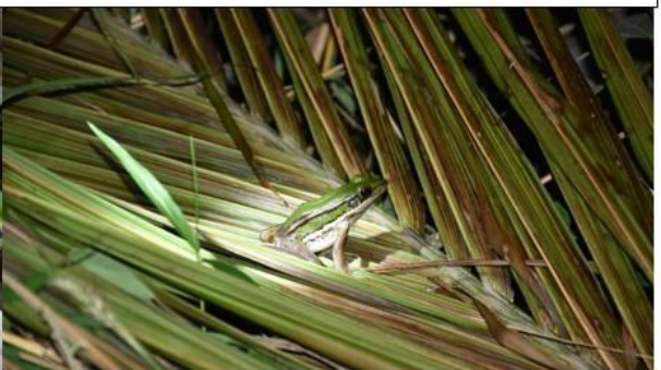
เขียดจิก