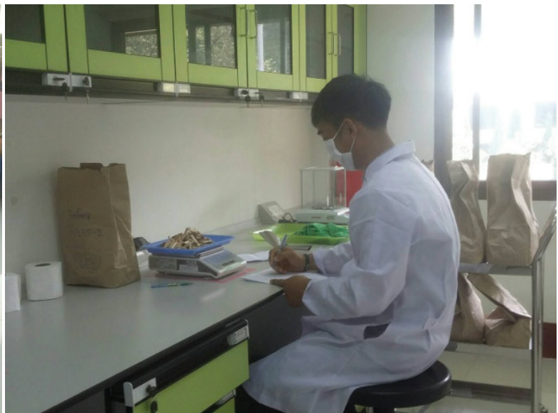
ภาพที่ 5 อบแห้งตัวอย่างด้วยตู้อบลมร้อน (Hot air oven) ที่อุณหภูมิ 80 องศาเซลเซียส เป็นเวลาต่อเนื่อง 5 วัน หรือจนน้ำหนักแห้งคงที่ และบันทึกน้ำหนักแห้งของเซียงแต่ละระดับ

6. การหาปริมาณคาร์บอนคงตัว (Fixed carbon) เป็นค่าที่แสดงถึงส่วนที่เผาไหม้หลังจากที่กำจัดความชื้น สารระเหย และเถ้าออกแล้ว ซึ่งหาได้โดยนำปริมาณความชื้น เถ้า สารระเหย ลบออกจาก 100 และทุกค่าต้องอยู่ในสภาวะความชื้นเดียวกัน