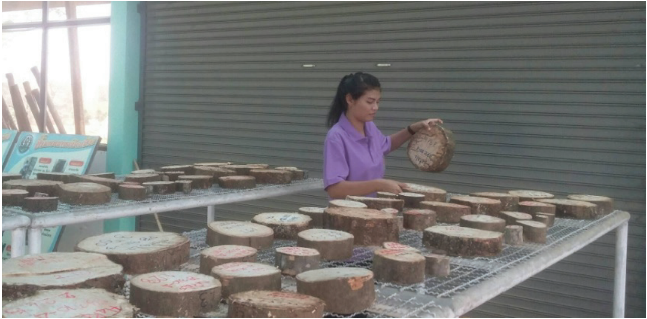
ภาพที่ 4 วัดเส้นรอบวงของเซียงแต่ละระดับ และบันทึกรายละเอียดต่างๆ ในด้านล่าง (ด้านที่อยู่ส่วนราก)