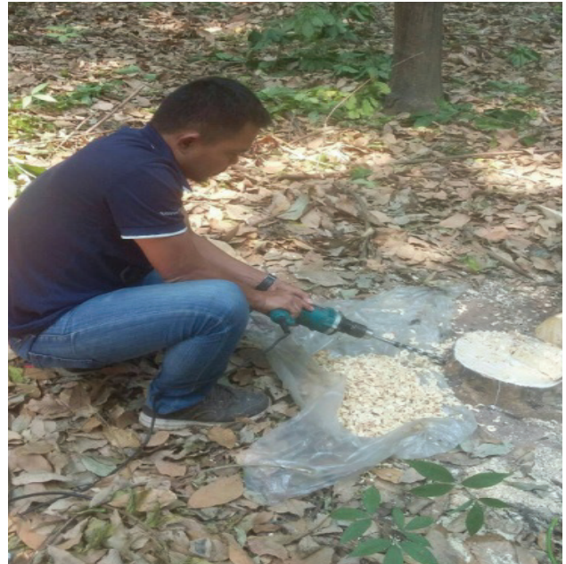
ภาพที่ 3 การเก็บเนื้อไม้โดยใช้วิธีเจาะในส่วนต่อ และซุดในส่วนของราก

substance) ให้หมดไป ส่วนที่เหลือคือ สารอินทรีย์สำหรับองค์ประกอบของเถ้าขึ้นอยู่กับชนิดของพืชและวิธีการเผา เถ้าประกอบด้วย แร่ธาตุต่าง ๆ เช่น แคลเซียม ฟอสฟอรัส เหล็ก โซเดียม โพแทสเซียม และแมกนีเซียม ทำการวิเคราะห์ตามวิธีมาตรฐาน ASTM D 3174 โดยนำตัวอย่างไปเผาให้ความร้อนในเตาเผาที่อุณหภูมิ 575 องศาเซลเซียส เป็นเวลา 3-4 ชั่วโมง จนกระทั่งได้น้ำหนัก