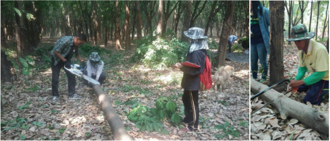
ภาพที่ 1 การตัดแยกส่วนของยอดและลำต้น