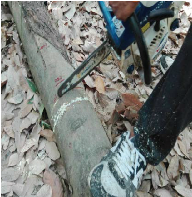
ภาพที่ 2 เก็บตัวอย่างลำต้นเป็นชิ้น ความหนา 5 เซนติเมตร ที่ระดับความสูง 6 ระดับ ได้แก่ L1 (0.90-0.95 ม., เป็นช่วงที่กรี๊ด), L2 (2.65-2.70 ม.), L3 (5.95-6.00 ม.), L4 (9.95-10.00 ม.), L5 (13.95-14.00 ม.) และ L6 (17.95-18.00 ม.) ตามลำดับ