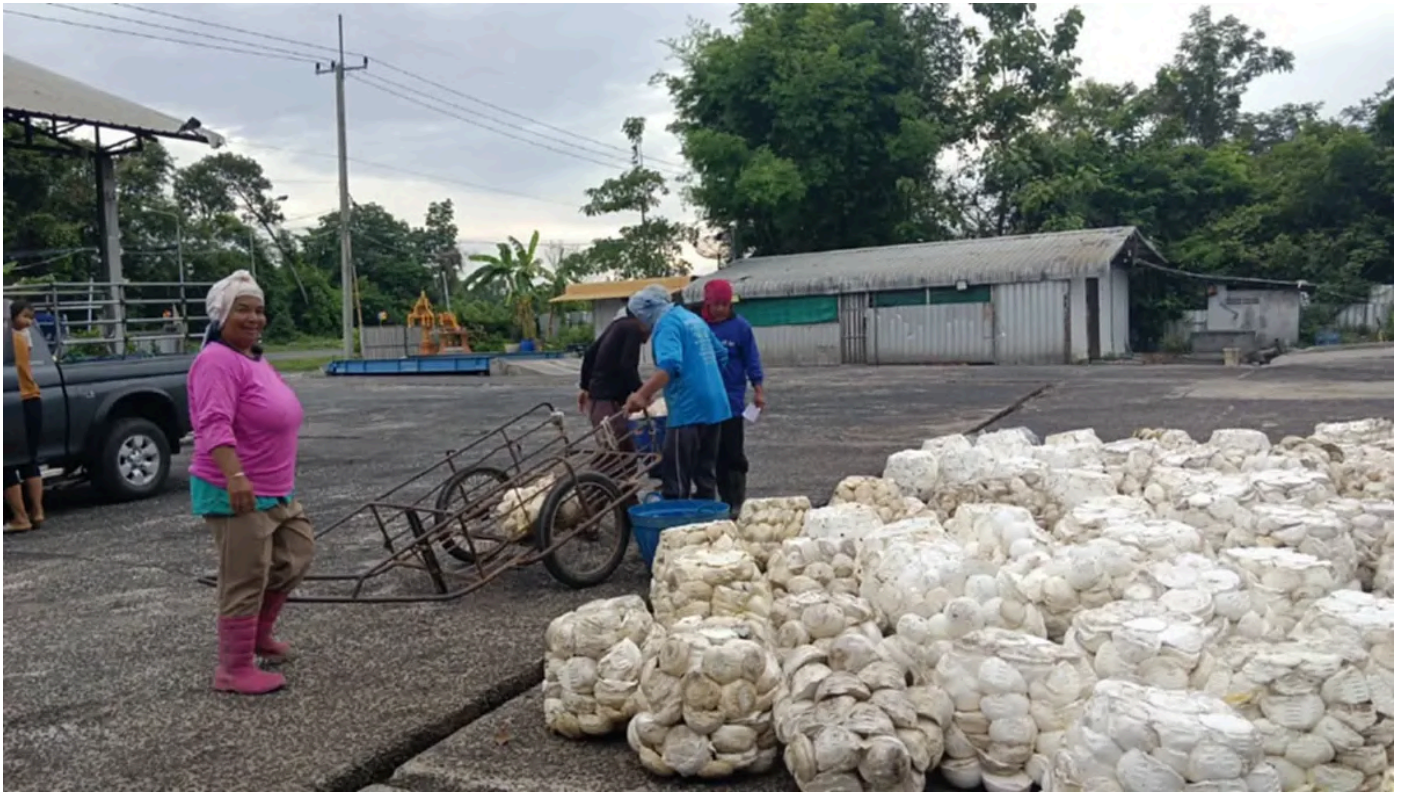
ยางพาราขายแดนฟุงกิโละละ 46.20 บาท แต่ชาวสวนกุมขมับ เพราะเหตุนี้