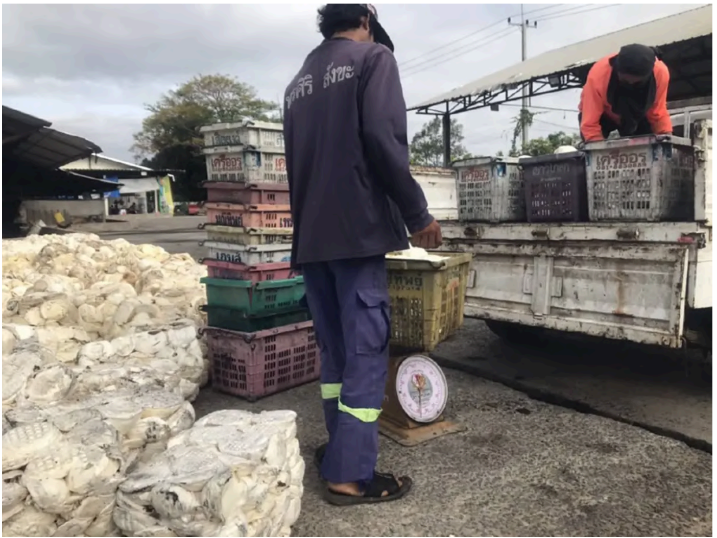
ยางพาราขายแดนฟุงกิโละ 46.20 บาท แต่ชาวสวนกุมขมับ เพราะเหตุนี้