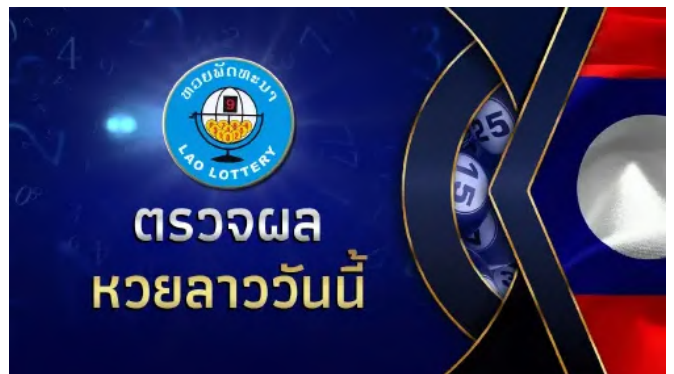
"หวยลาววันนี้8/6/69" ลังค์ถ่ายทอดสด หวยลาว หวยลาวล่าสุด8 06 69