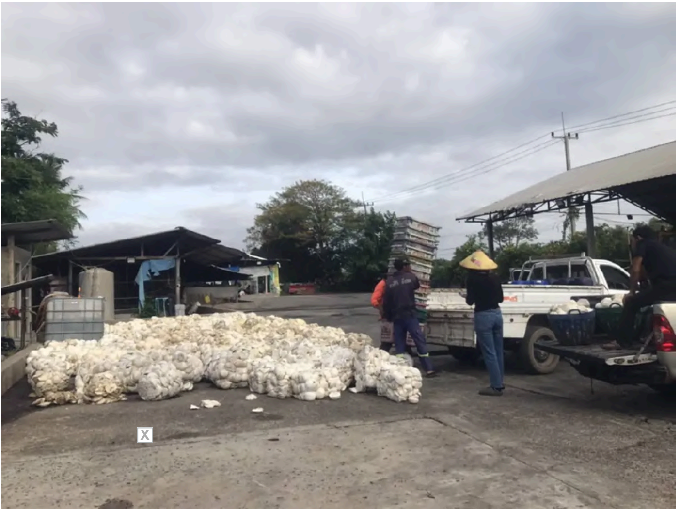
ยางพาราขายแดนฟุงกิโละ 46.20 บาท แต่ชาวสวนกุมขมับ เพราะเหตุนี้

เจ้าของร้านกล่าวเพิ่มเติมว่า ร้านเปิดรับซื้อยางทุกวันตั้งแต่เวลา 05.00-12.00 น. โดยไม่มีวันหยุด และหากเกิดสถานการณ์อภัยพลาจากปัญหาชายแดน ทางร้านก็ยังพร้อมเปิดรับซื้อเพื่อช่วยเหลือเกษตรกรในพื้นที่ อย่างไรก็ตาม ชาวบ้านจำนวนมากยังคงติดตามสถานการณ์อย่างใกล้ชิด และเตรียมความพร้อมหากต้องมีการอพยพเป็นครั้งที่ 3