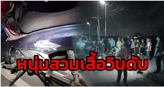
25 พฤษภาคม 2569 จ.สมุทรปราการ หนุ่มสวมเสื้อวิน ชีร์จักรยานยนต์เสียหลักพลิกคว่ำ ศีรษะฟาดเสาไฟฟ้าบาดเจ็บสาหัส กู้ชีพ - กู้ภัยเร่งทำ CPR แต่ไม่เป็นผล