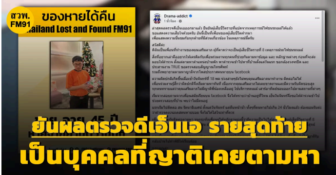
25 พฤษภาคม 2569 ผลตรวจดีเอ็นเอ เหยื่อรถไฟชนรถเมล์ รายสุดท้าย ยืนยันเป็นบุคคลที่ญาติเคยตามหา ผ่านทาง FM91 Trafficpro