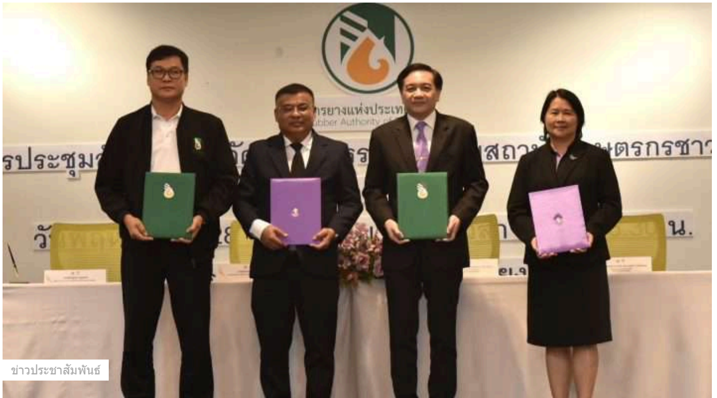
ข่าวประชาสัมพันธ์

Breaking News: “เทอม 4” เปิดรอบพิเศษ! รอบสื่อมวลชน