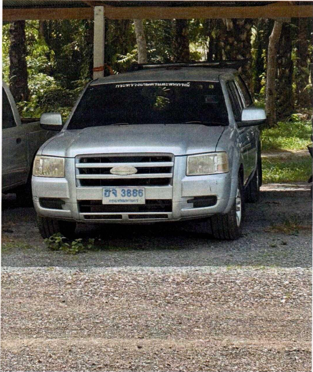
รถยนต์ ฮจ 3886 กรุงเทพมหานคร