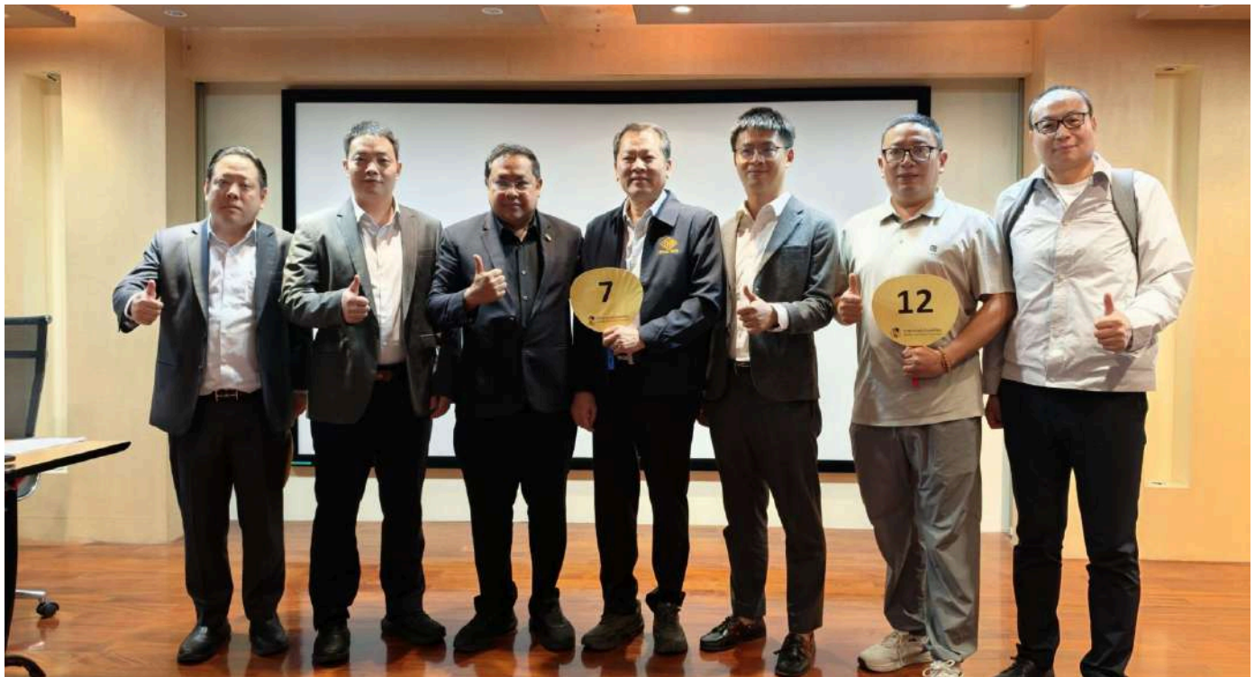
กยท. ประมูลขายทอดตลาดยางจาก 2 โครงการ 'พัฒนาศักยภาพสถาบันเกษตรกร-สร้างมูลค่าเพิ่ม' รวมกว่า 18,000 ตัน มูลค่าปิดประมูล 1,232 ล้านบาท ยืนยัน! ระบายยางช่วงที่เหมาะสม ไม่กระทบราคาและปริมาณยางในตลาด