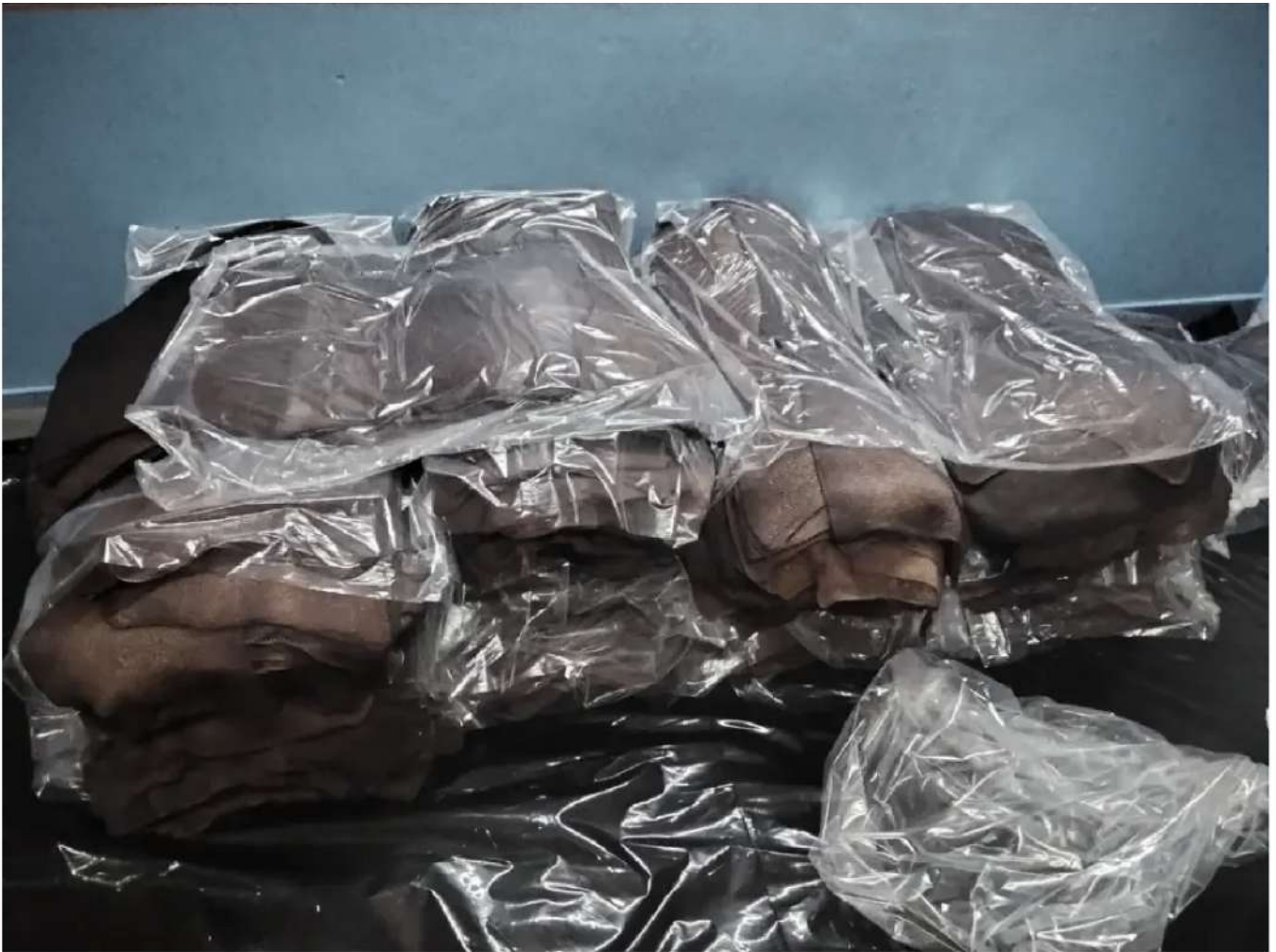
ยาง ADS (Air Dried Sheet) หรือที่เรียกว่า ยางแผ่นผึ่งแห้ง

อนึ่ง "ยาง ADS (Air Dried Sheet) " หรือที่เรียกว่า ยางแผ่นผึ่งแห้ง คือยางแผ่นดิบที่ผ่านกระบวนการทำให้แห้งด้วยการผึ่งลมร้อนหรือแดดเพื่อไล่ความชื้น โดยไม่ผ่านการรมควัน (แตกต่างจากยาง RSS หรือยางแผ่นรมควัน) ยางประเภทนี้มักมีสีเหลืองอ่อนหรือสว่าง มีความสะอาดสูง และยืดหยุ่น