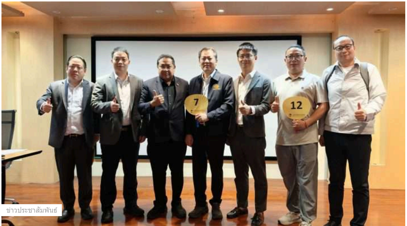
ข่าวประชาสัมพันธ์

Breaking News: ครั้งแรกในไทย! ทรุ ผนึก QTRic เครือข่ายควอนตัมในไทย และ qBraid จากสหรัฐอเมริกา ลงนาม MoU สร้างระบบนิเวศด้าน Quantum AI