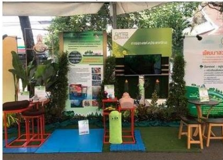
ดูรูปทั้งหมด

ข่าวบันเทิง ThaiPR.net -- พุธที่ 31 มกราคม 2561 11:03:09 u.