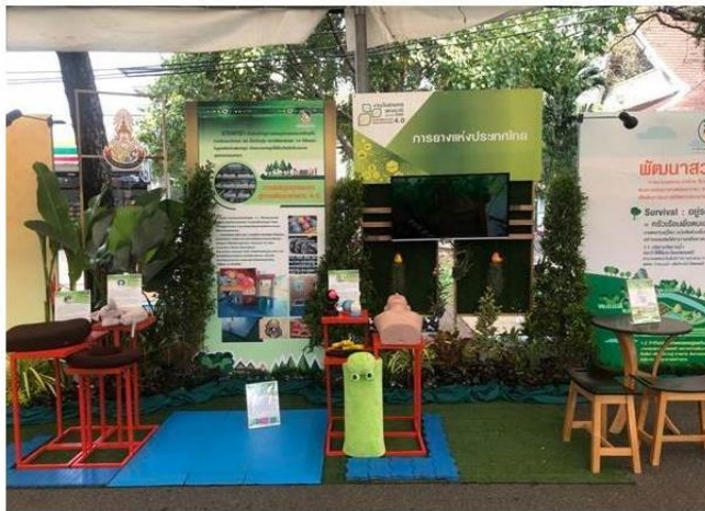
กรุงเทพฯ--31 ม.ค.--การยางแห่งประเทศไทย

ขนาดตัวอักษร: ใหญ่ กลาง เล็ก Share 0 Like 0 Tweet