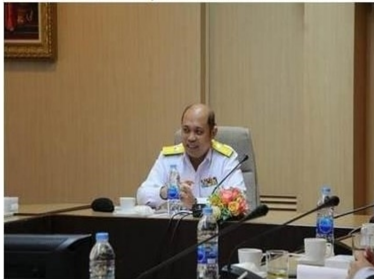
ครบทั้งหมด

ข่าวทั่วไป ThaiPR.net -- พุธที่ 31 มกราคม 2561 16:23:15 น.