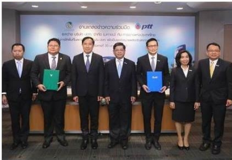
ดูรูปทั้งหมด

ข่าวทั่วไป ThaiPR.net -- Wed 31 Jan 2018 17:05:21