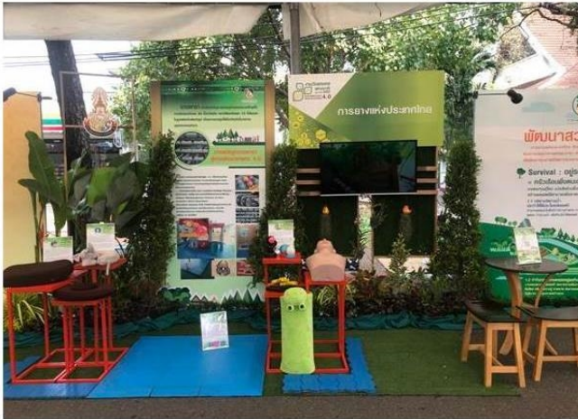
กรุงเทพฯ--31 ม.ค.--การยางแห่งประเทศไทย

ข่าวประชาสัมพันธ์ทั่วไป Wednesday January 31, 2018 11:03