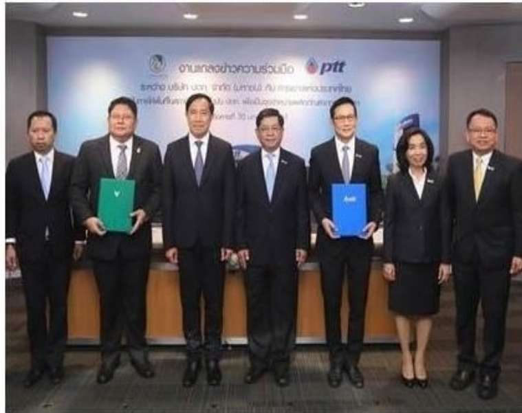
รูปทั้งหมด

ข่าวทั่วไป ThaiPR.net -- Wed 31 Jan 2018 17:05:21