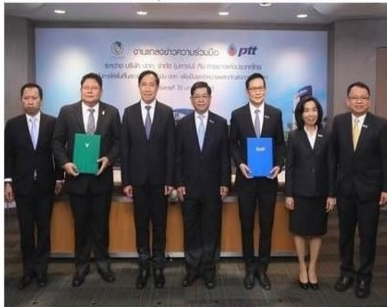
ดูรูปทั้งหมด

ข่าวทั่วไป ThaiPR.net -- พุธที่ 31 มกราคม 2561 17:03:03 น.