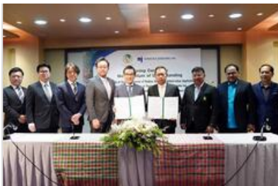
กยท. MOU บ.เอกชนญี่ปุ่น มุ่งวิจัยเมล็ดยาง เพิ่มมูลค่าสู่พลังงานสีเขียว