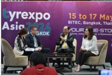
กยท. ลุยงานมหกรรม “TyreXpo Asia 2024” โชว์ศักยภาพยางไทยรองรับ EUDR