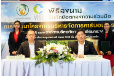
กยท. MOU อบก. บริหารจัดการคาร์บอนเครดิตในสวนยาง เพิ่มรายได้เสริมเกษตรกร