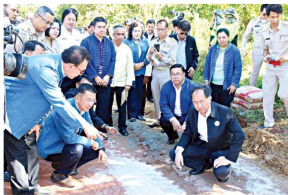
10 มกราคม 2562 ที่ผ่านมา

นายกฤษฎา บุญราช รัฐมนตรีว่าการกระทรวงเกษตรและสหกรณ์ กล่าวว่า เนื่องจากคณะรัฐมนตรี ได้มีมติเห็นชอบการดำเนินโครงการส่งเสริมการใช้จ่ายในหน่วยงานภาครัฐ เพื่อแก้ไขปัญหาสถานการณ์ราคายางพาราตกต่ำในปัจจุบัน จึงมีนโยบายเพิ่มปริมาณการใช้จ่ายพาราในประเทศ โดยส่งมอบให้หน่วยงานภาครัฐนำไปใช้ประโยชน์และเพิ่มรายได้ให้กับเกษตรกรและชาวสวนยางพารา และแจ้งให้องค์กรปกครองส่วนท้องถิ่น จัดทำโครงการก่อสร้าง/ปรับปรุงถนนที่มีส่วนผลของยางพาราหรือสิ่งก่อสร้างอื่น ๆ ที่ใช้ยางพาราเป็นลำดับแรก ลำสุด องค์การบริหารส่วนจังหวัดเชียงใหม่ได้ร่วมลงนามทำบันทึกข้อตกลงความร่วมมือทางวิชาการว่าด้วยความร่วมมือถ่ายทอดเทคโนโลยี ด้านการปรับปรุงถนนพาราดินซีเมนต์ เพื่อการพึ่งพาตนเองของประเทศไทยในอนาคตร่วมกับสถาบันวิชาการแห่งชาติ มหาวิทยาลัยเทคโนโลยีราชมงคลธัญบุรี เมื่อวันที่