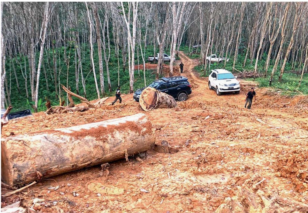
รูปป่า - สภาพพื้นที่ป่าใกล้อุทยานแก่งกรุง อ.วิภาวดี จ.สุราษฎร์ธานี ถูกผู้บุกรุกตัดไม้และถางป่าเป็นพื้นที่จำนวนมาก เจ้าหน้าที่ได้จับกุมนายทุนผู้บุกรุกหลายราย เมื่อวันที่ 27 มกราคม

เมื่อวันที่ 27 มกราคม นางอำนวยการพรชลดำรงศักดิ์ รองอธิบดีและโฆษกกรมป่าไม้ กระทรวงทรัพยากรธรรมชาติและสิ่งแวดล้อม