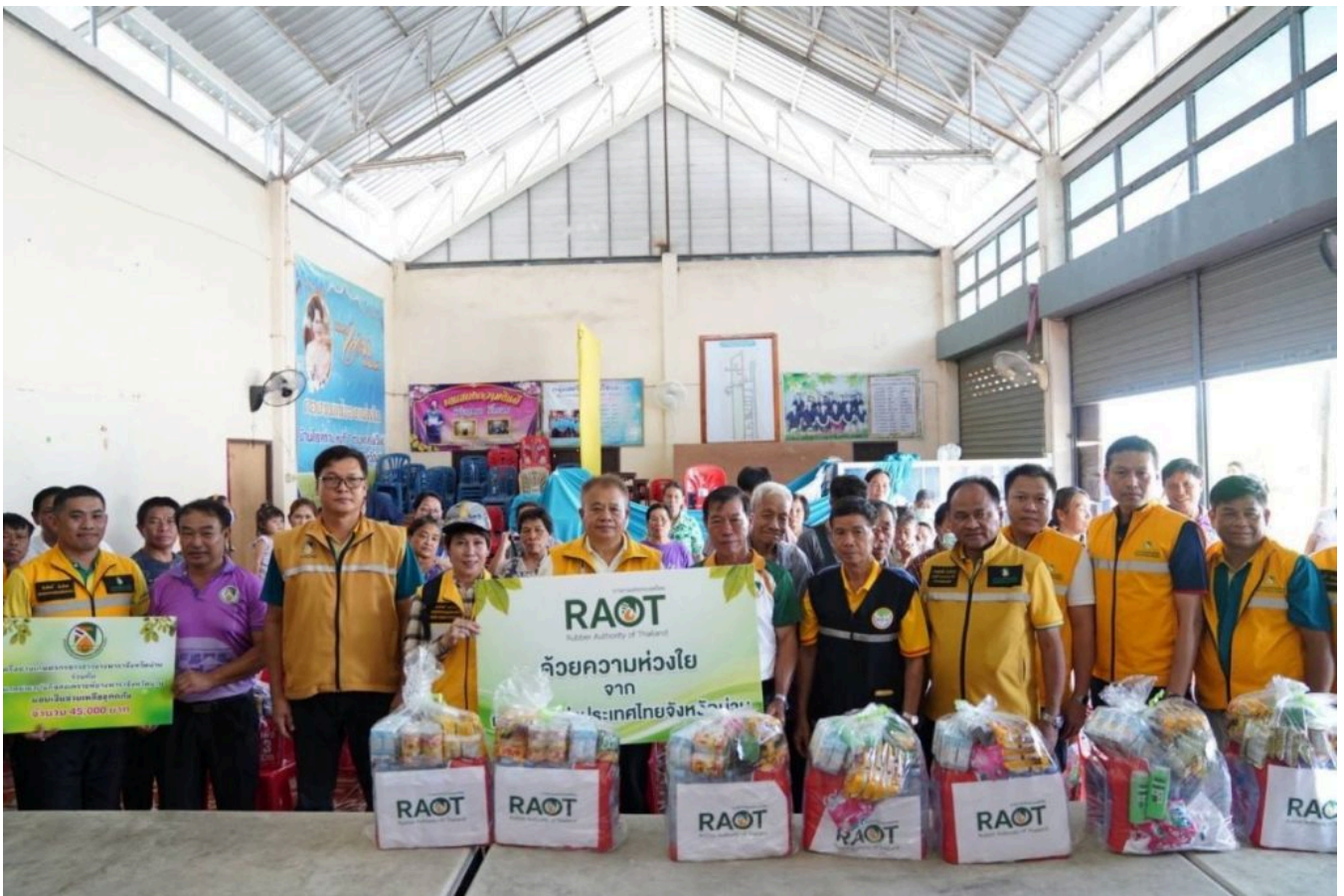
ทีมข่าวประชาสัมพันธ์ กยท.

#สมาคมหนังสือพิมพ์ส่วนภูมิภาคแห่งประเทศไทย