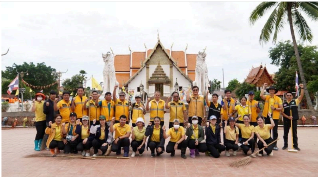
ข่าวภูมิภาค