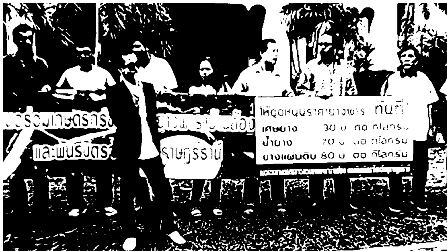
มือสวนยางภาคใต้รวมตัวเรียกร้องให้รัฐบาลช่วยเหลือเมื่อช่วงต้นสัปดาห์ที่ผ่านมา

สำนักงานพาราที่ตกต่ำอย่างหนักที่สุดในรอบ 4 ปี ส่งผลต่อภาพรวมเศรษฐกิจในพื้นที่ภาคใต้อย่างหนักหน่วง