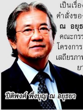
ปิตพงษ์ พึ่งบุญ ณ อยุธยา

เป็นเรื่องใหม่ละกับการลงนามเซ็นคำสั่งของ นายปิตพงษ์ พึ่งบุญ ณ อยุธยา รมว.เกษตรฯ แต่งตั้งคณะกรรมการตรวจสอบข้อเท็จจริงโครงการสร้างมูลภัณฑ์กันชนรักษาเสถียรภาพราคายางขององค์การสวนยาง (กสย.)