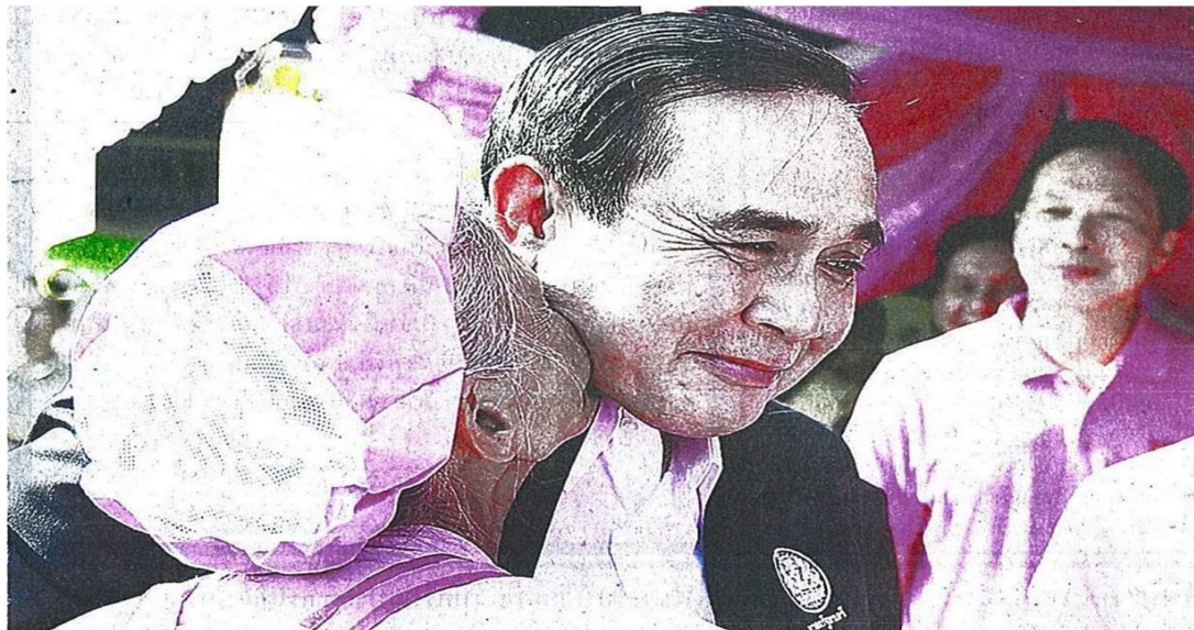
◀ ชื่นใจฉาย พล.อ.ประยุทธ์ จันทร์โอชา นายกรัฐมนตรี ออกอาการเขินพร้อมหัวเราะชอบใจ เมื่อคุณยายวัย 85 ปี ตรงเข้าหอมแก้มพลเอกใหญ่ และชมว่าตัวจริงหล่อกว่าในโทรทัศน์ ระหว่างนายกฯ ลงพื้นที่ติดตามการแก้ปัญหาภัยแล้งตาม 8 มาตรการของรัฐบาล ที่นครสวรรค์.