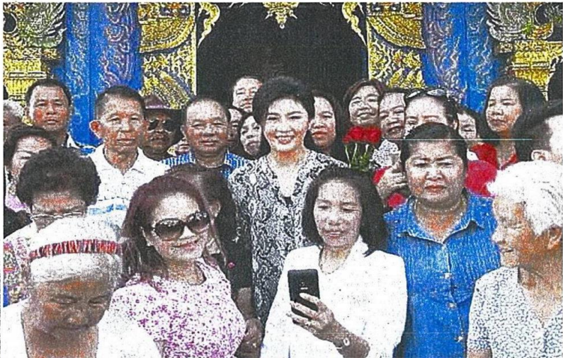
ขึ้นเชียงราย น.ส.ยิ่งลักษณ์ ชินวัตร อดีตนาย กษ- โพลศึกษาถ่ายภาพกับ ประชาชนลงในเฟซบุ๊ก พร้อมระบุว่า มาที่วัดร่องเสือเต้น จ.เชียงราย วัดร ที่ที่สวยงาม ใช้ลักษณะสีพื้นเป็นสถาปัตยกรรมที่โดดเด่น และเป็นเรื่องบังเอิญ ที่วัดตั้งในปีและ ท่านเจ้าอาวาสก็เกิดปีแพะ ตนก็เกิดปีแพะด้วย ดีใจที่ได้ มีโอกาสมาไหว้พระในวันนี้.

"บักดู๋" ปลื้ม "กุดขยาย" ชมตัวจริงหล่อ เมื่อเวลา 07.00 น. ที่ พล.ม.2 รอ. พล.อ. ประยุทธ์ จันทร์โอชา นายกรัฐมนตรี และหัวหน้า ณะรักษาความสงบแห่งชาติ (คสช.) พร้อมด้วย นายสมคิด จาคูศรีพิทักษ์ รองนายกรัฐมนตรี พล.อ. อุนพงษ์ เผ่าจินดา รว.มหาดไทย พล.อ.ฉัตรชัย สาริกัลยะ รว.เกษตรและสหกรณ์ และ พล.อ.สุรศักดิ์ กาญจนรัตน์ รว.ทรัพยากรธรรมชาติและสิ่งแวดล้อม ขึ้นเฮลิคอปเตอร์เดินทางลงพื้นที่ จ.นครสวรรค์ และ จ.ชัยนาท ติดตามการแก้ไขปัญหาภัยแล้งตาม 8