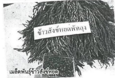
เมล็ดพันธุ์ข้าวสังข์หยด

การ จากนั้นทั้งหมดลงพื้นที่ตามจุดต่างๆ เริ่มจากสำรวจพันธุ์ข้าวพื้นเมือง ที่ อ.คิชฌา กาญจนจันทร์ ผู้เชี่ยวชาญด้านข้าวจัดเตรียมไว้ มีทั้งเมล็ดพันธุ์ข้าวพื้นเมืองดั้งเดิม อาทิ ข้าวสังข์หยด และเมล็ดพันธุ์ที่เพิ่งค้นพบใหม่ ได้แก่ ข้าวเล็บกิสต้า ข้าวเมล็ดฝ้าย ข้าวดำหอมและอีกหลายสายพันธุ์ที่ถูกลืมเลือนหาย พร้อมแกะเกี่ยวข้าว อุปกรณ์เก็บเกี่ยวข้าวดั้งเดิมของชาวนาในภาคใต้ด้วย หลังรับฟังที่มาที่ไปของข้าวแต่ละสายพันธุ์จาก อ.คิชฌา จากนั้นเดินทางไปยังจุดต่อไปเป็นแปลงเกษตรกรขนาดใหญ่ที่ใช้เป็นสถานที่ฝึกงานของนักศึกษาสาขาพืชศาสตร์ และโครงการอนุรักษ์พันธุกรรมพืชที่เต็มไปด้วยพืชท้องถิ่นหลากหลายสายพันธุ์ รวมทั้งหม้อข้าวหม้อแกงลิง ที่ปัจจุบันพบเห็นได้ยากมากแล้ว