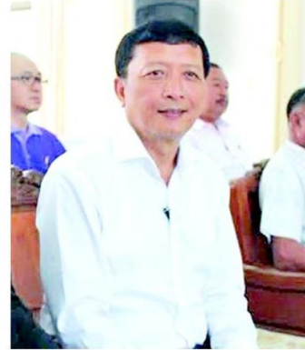
อบจ.พังงา กล่าว

“โดยเฉพาะการแก้ปัญหาการค้ายางพาราตกต่ำได้นำเสนอเบื้องต้นแก่สมาชิกของสมาพันธ์ อบจ.ภาคใต้ ให้เร่งโครงการที่ใช้ยางพาราเป็นส่วนผสม เช่น การทำถนนที่มีส่วนผสมจากยางพารา การทำผลิตภัณฑ์จากยางพารา และแนวโน้มนำมาจัดตั้งโรงงานผลิตภัณฑ์จากยางพารา และแนวโน้มนำมาจัดตั้งโรงงานผลิตภัณฑ์จากยางพารา นับว่าเป็นการแก้ปัญหาการค้ายางพาราที่พี่น้องเกษตรกรผู้ทำสวนยางพาราประสบอยู่ในขณะนี้” นาย