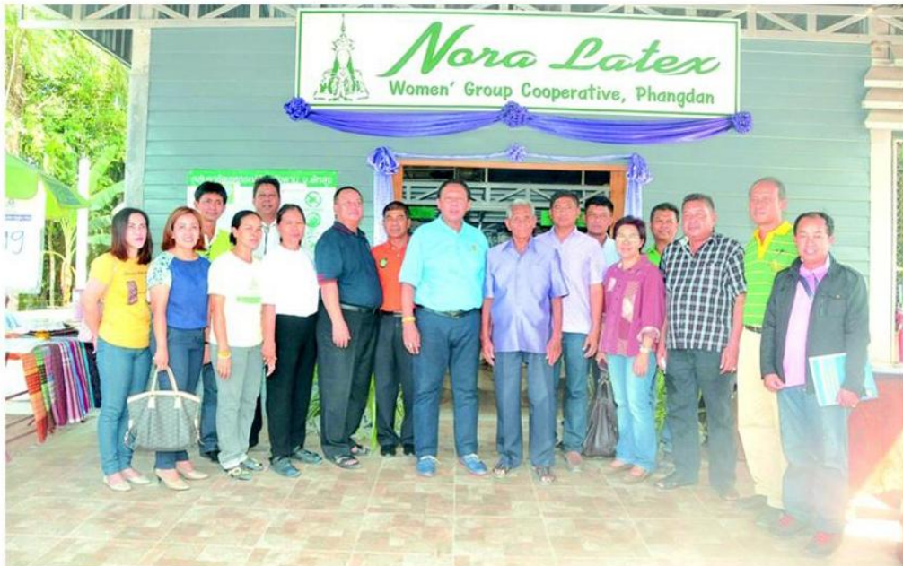
↑ เปิดจุดสาธิต...สมชาย ชาญณรงค์กุล อธิบดีกรมวิชาการเกษตร เป็นประธานในพิธี เปิดจุดสาธิตและเรียนรู้การแปรรูปหมอนยางพาราในระดับชุมชน ที่วิสาหกิจชุมชน กลุ่มอาชีพสหกรณ์บ้านพังดาน ต.นาขยาด อ.ควนขนุน จ.พัทลุง เมื่อวันก่อน