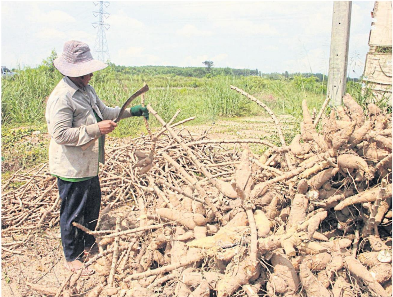
A farmer harvests tapioca. The cabinet yesterday approved 14.1 billion baht worth of price guarantees for tapioca, corn and rubber, to be handled by the Bank for Agriculture and Agricultural Cooperatives. SONTHANAPORN INCHAN