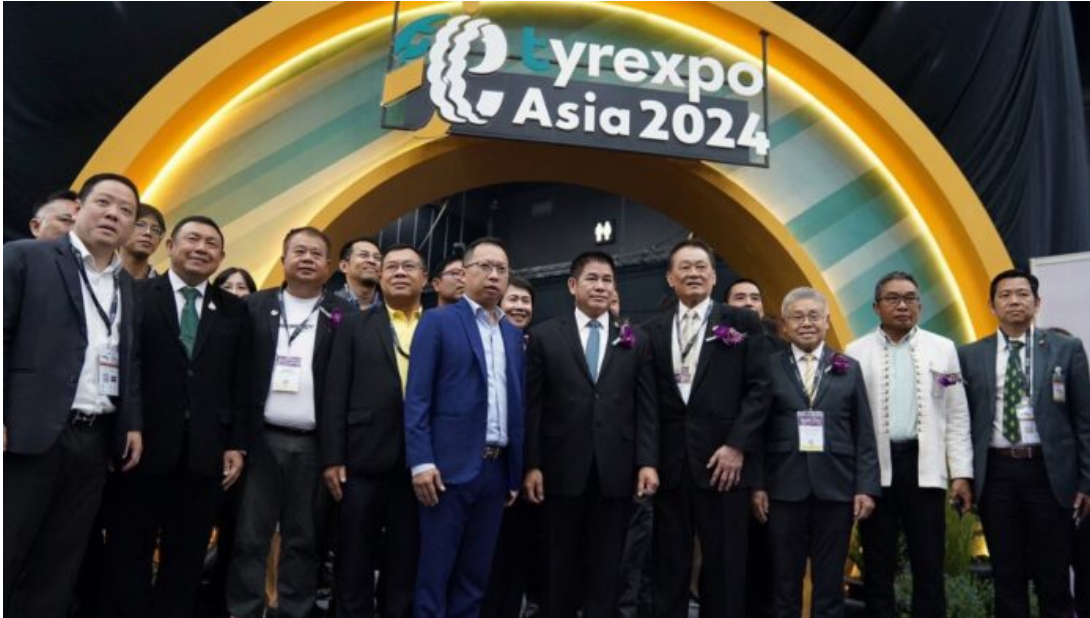
Thailand hosts the first TyreXpo Asia 2024

Rubber Authority of Thailand (RAOT) announced the inaugural international tyre exhibition, TyreXpo Asia 2024.