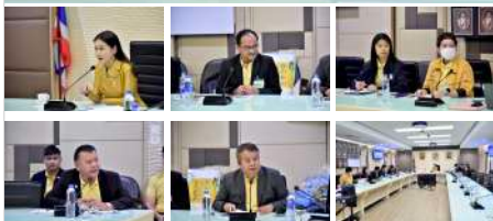
ข่าวที่เกี่ยวข้อง