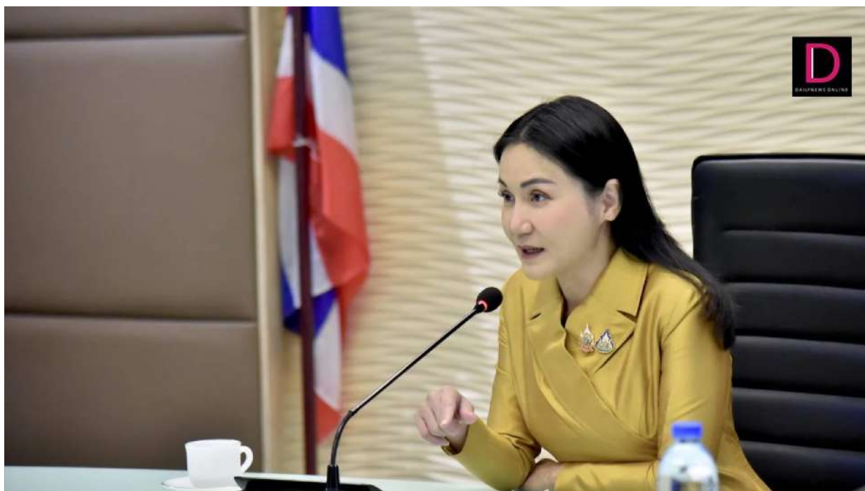
“นฤมล”หารือการยางแห่งประเทศไทย เพื่อเตรียมเสนอวาระเร่งด่วนในการประชุม กนย.