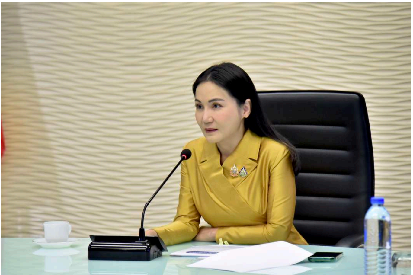
อัลบั้มภาพ

นอกจากนี้ ที่ประชุมได้รายงานความคืบหน้า การจัดทำบันทึกความเข้าใจ (MOU) ระหว่าง Malaysian Rubber Board (MRB) ประเทศมาเลเซีย กับการยางแห่งประเทศไทย (กยท.) เพื่อการพัฒนาด้านการค้ายางพาราและความร่วมมือทางเศรษฐกิจตามที่ รวม.เกษตรฯ ได้เดินทางเจรจาด้านการค้าการลงทุนในอุตสาหกรรมยางพารา ณ กรุงกัวลาลัมเปอร์ ประเทศมาเลเซียเมื่อวันที่ 11 ก.ค.67 ที่ผ่านมา ซึ่งขณะนี้ MOU ดังกล่าวอยู่ในขั้นตอนการเตรียมเสนอคณะรัฐมนตรี (ครม.) โดยมีวัตถุประสงค์เพื่อร่วมกันส่งเสริม สนับสนุน ความร่วมมือในการบริหารจัดการการผลิตยางพาราให้สอดคล้องต่อความต้องการในอุตสาหกรรมยางพาราของทั้ง 2 ประเทศ ให้เกิดความมั่นคงและยั่งยืนทางเศรษฐกิจเพื่อประโยชน์ของผู้ผลิตและผู้บริโภค ตลอดจนส่งเสริมและสนับสนุนด้านการค้าและอุตสาหกรรมยางพารา ให้มีคุณภาพและมาตรฐานสร้างความมั่นคงในระยะยาวของห่วงโซ่อุปทาน รวมไปถึงส่งเสริมด้านความยั่งยืนของอุตสาหกรรมยางพาราในการตรวจสอบย้อนกลับ และการแก้ไขปัญหาและความท้าทายที่เกี่ยวข้อง และร่วมกันพัฒนางานวิจัยที่เกี่ยวข้อง กับยางพาราในด้านการผลิตและอุตสาหกรรม