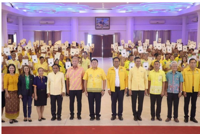
สตูล จัดพิธี Kick Off “มอบโฉนดต้นไม้และโฉนดต้นยางพารา” ยกระดับเศรษฐกิจฐานราก สร้างความมั่นคงในอาชีพเกษตรกร